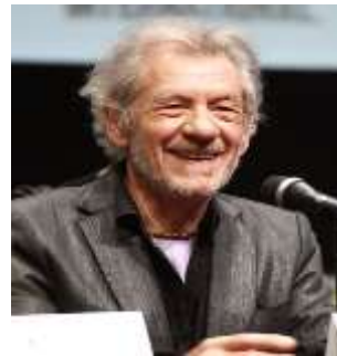
aktor Ian McKellen