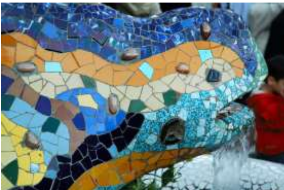
Mozaika A. Gaudiego