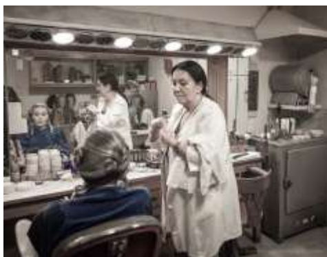
Charakteryzatorka teatralna przy pracy

Gdybym ich spotkał na ulicy nie rozpoznałbym ich. A Ty ?